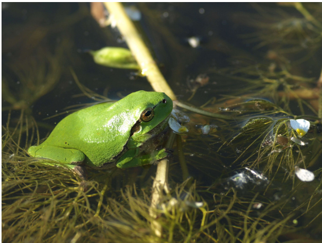
Rainette verte marais de Berthecourt, mai 2008

rainette verte dans le nord qui se distinguent par une bande noire parcourant ses flancs et se dessinant à partir des narines.