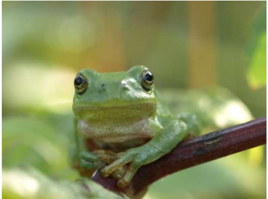
Rainette méridionale ( hyla meridionalis ) Laroque des albères (66), 2008

postérieurs assez courts et des orteils munis de petites ventouses adhésives qui leur permettent de grimper aux arbres.